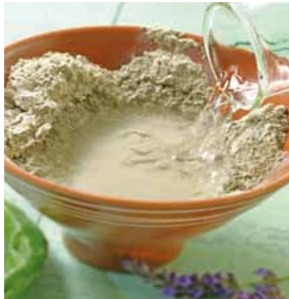
L'argile est un moyen extraordinaire que nous offre la nature pour soigner de nombreux maux d'une manière particulièrement efficace.

pauvres se suicident en buvant du paraquat, un herbicide extrêmement toxique. Le seul traitement qui puisse les sauver est l'argile (sous le terme de « terre à foulon » dans les livres médicaux). Car, tout en restant dans le tube digestif, celle-ci parvient à récupérer le poison, même lorsqu'il est déjà passé dans le sang, par un phénomène dénommé dialyse intestinale . La même efficacité a été démontrée pour l'arsenic, ainsi que pour la strychnine, la fameuse « mort-aux-rats ».